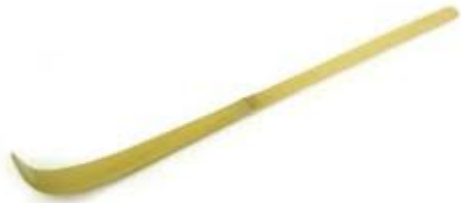
'chasaku', [een lange dunne lepel van bamboe],

Usucha [vertaald als 'dunne thee'], is matcha van jongere theeplanten en wordt dagelijks gebruikt. Het is een dunne substantie en matig-krachtig van smaak.