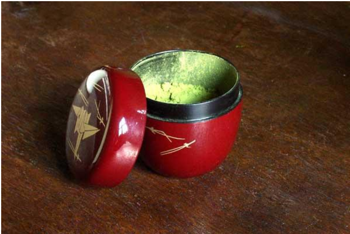
doosje met matcha

De geknielde gastheer of gastvrouw zet de bereide kom met thee voor de hoofdgast neer en maakt daarna een buiging. De gast dient, eveneens na het maken van een buiging, de kom te pakken en op de palm van zijn linkerhand te plaatsen. Met de rechterhand wordt de kom met 3 kleine rotaties met de klok mee gedraaid en kan er, met gepaste eerbied, gedronken worden. Na het drinken wordt het deel van de kom waar men gedronken heeft met de rechterhand schoongeveegd en de kom wordt, na weer 3 kleine rotaties nu tegen de klok in, op de grond neergezet.