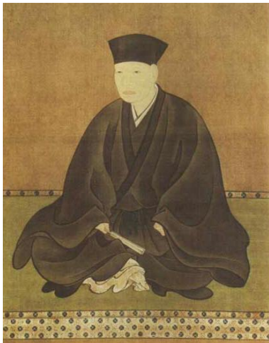
Sen no Rikyu

Thee werd in de 8ste eeuw in Japan geïntroduceerd, maar het was pas vanaf de 13e eeuw dat men matcha, [de basis van elke theeceremonie], begon te gebruiken. Via Boeddhistische monniken, die als eersten in Japan thee dronken en zo introduceerden, kwam dit gebruik in de Zen kloosters terecht. De dagenlange stiltemeditaties werden even onderbroken door het drinken van een kopje groene thee. Deze Zen monniken stelden vast dat het theedrinken een middel was om urenlang te kunnen blijven mediteren. Daardoor geraakte het drinken van thee stilaan ingeburgerd in de Japanse samenleving en ontstonden er wel omschreven rituelen rond het zetten en drinken van thee. De Japanse theeceremonie dateert uit 1286 toen volgens de overlevering de monnik Sjomei alle benodigdheden voor het theedrinken uit China aanvoerde.