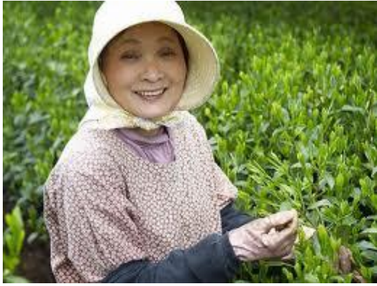
oogst van de theeblaadjes

De met de hand geplukte theeblaadjes worden gedroogd bij een temperatuur van 180°. De droge blaadjes krijgen nu een nieuwe naam 'Aracha' of 'ruwe thee'.